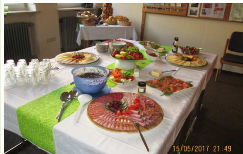
reichhaltiges Frühstücksbuffet beim Frauenfrühstück